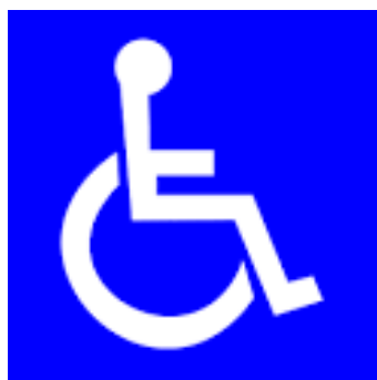
สัญลักษณ์คนพิการ