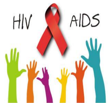
สัญลักษณ์วันเอดส์โลก