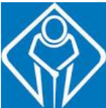
สัญลักษณ์ผู้สูงอายุ

ส่วนสวัสดิการสังคม องค์การบริหารส่วนตำบลมาบปลาเค้า โทร. ๐๓๒ - ๕๐๖๑๔๑